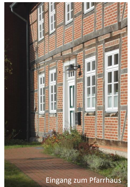
Eingang zum Pfarrhaus