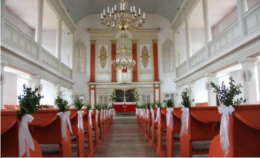
St. Stephani, Meine