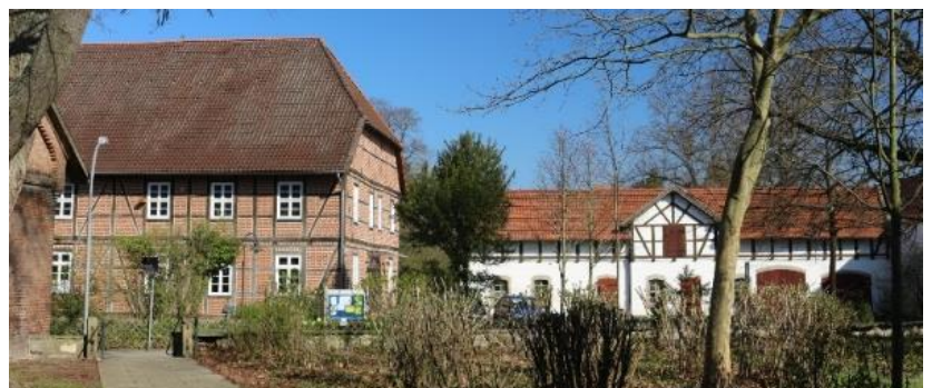
Blick von der Kirche zum Pfarrhaus