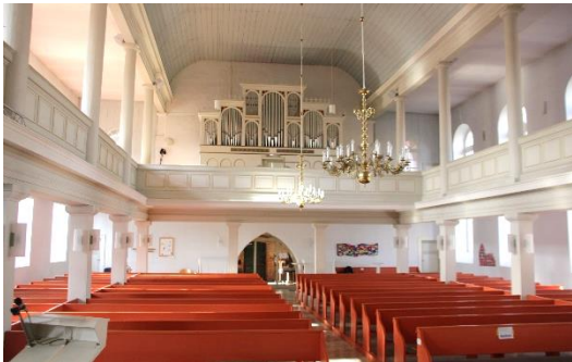
Furtwängler-Orgel in St. Stephani