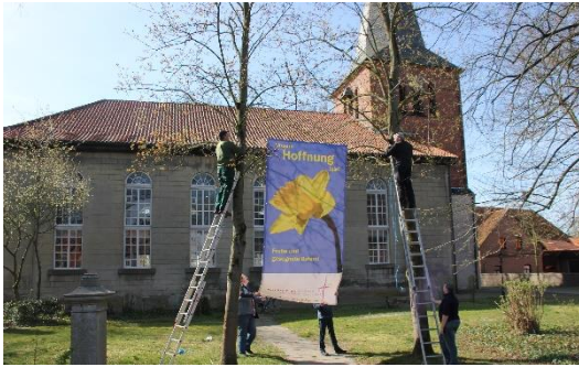
St. Stephani, Meine

Die „ Teestube “ mit zwei Gruppenräumen und Küche wird für vielseitige Aktivitäten von Posaunenchor bis Konfirmandenunterricht genutzt.