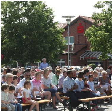
Ökumenischer Pfingstgottesdienst auf dem Marktplatz

In der Patronatskapelle Wedesbüttel und der Kapelle Vordorf werden i.d.R. monatlich Gottesdienste gehalten, auch Taufen und Trauungen finden dort statt.