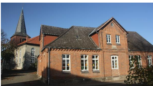
Die „Teestube“ an der Kirche