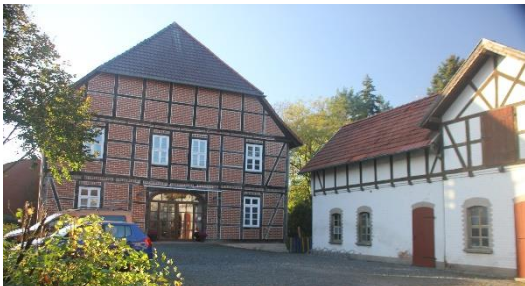
Eingang zum Gemeindehaus