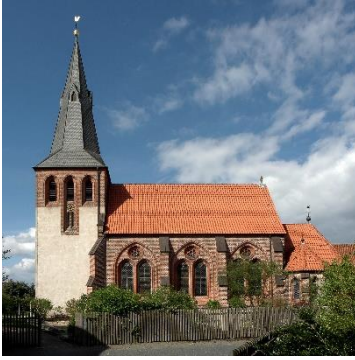
St. Vincenz, Grassel