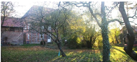
Garten des Gemeindehauses